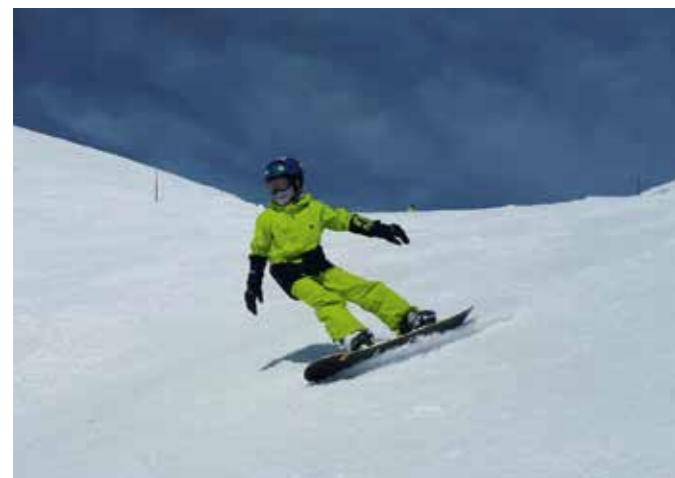
Goofy ou Regular?

Dès le mois de février, nous avons lancé des sorties OJ d'une demi-journée « COVID compatibles » au Grand-Paradis, à Champéry, dans le domaine skiable des Portes du Soleil. Afin d'éviter les mélanges et d'assurer une certaine distance entre les participants, les transports en commun ne furent pas utilisés.