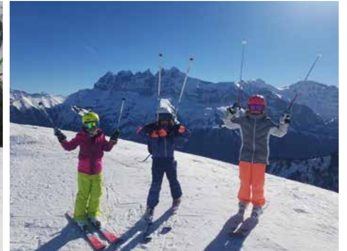
Les Portes du Soleil avec... du soleil bien sûr!