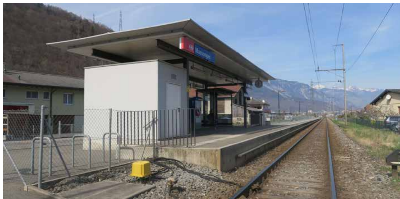
Réaménagement du quai de la gare.

Le développement de l'urbanisation est pensé conjointement avec le développement du réseau de mobilité. Pour tendre vers une mobilité durable, propice aux déplacements quotidiens et de loisirs, la commune de Massongex souhaite renforcer son offre en transports publics, notamment grâce au réaménagement du quai de la gare et à l'amélioration des connexions entre la gare et la future ligne du bus d'agglomération.