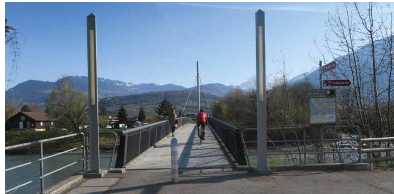
Réfection de la passerelle entre Massongex et Bex pour le passage des transports publics et des mobilités douces.

Le réseau de mobilité douce sera amélioré, par la réappropriation des rues historiques du village par les piétons et le renforcement des liaisons le long du Rhône ainsi qu'entre le hameau de Daviaz et le village de Massongex.