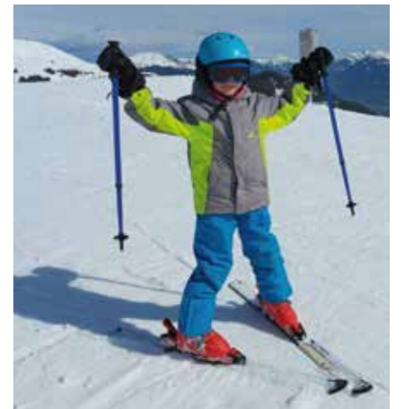
C'est le fils à qui, le p'tit nouveau?