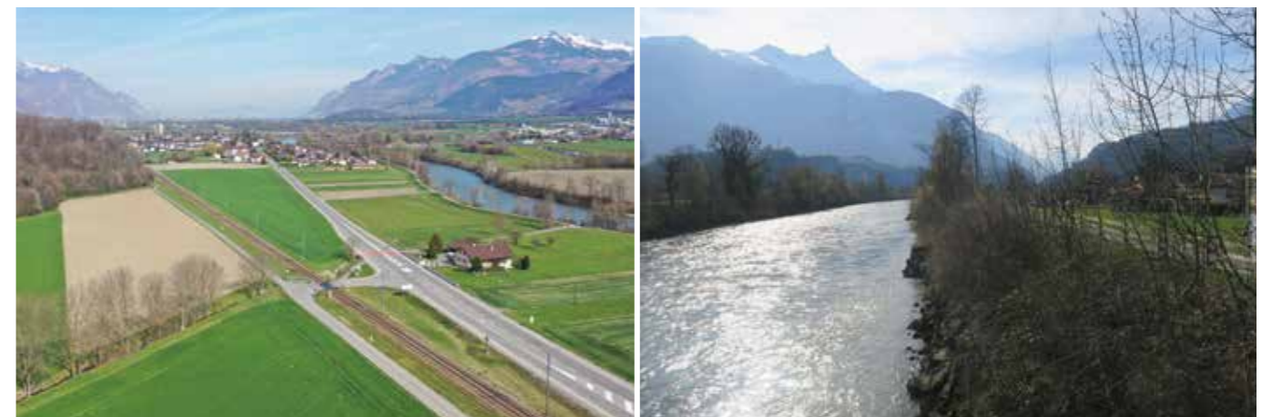
Maintien et consolidation des espaces agricoles autour du village de Massongex.

La valorisation et la mise en réseau des espaces naturels et paysagers inviteront à la détente pour tout habitant et/ou visiteur de la commune. Les espaces agricoles sur le territoire de plaine seront maintenus et consolidés. Des séquences paysagères, à la fois transversales, du hameau de Daviaz jusqu'au Rhône, et longitudinales, le long du Rhône, accompagneront la stratégie paysagère de la commune et connecteront chaque poche verte entre elles, tels que parcs, forêt et équipements sportifs de plein air. Enfin, la biodiversité sera améliorée et les corridors biologiques renforcés, notamment grâce à la renaturation de cours d'eau, telle que La Rogneuse dans le secteur des Paluds.