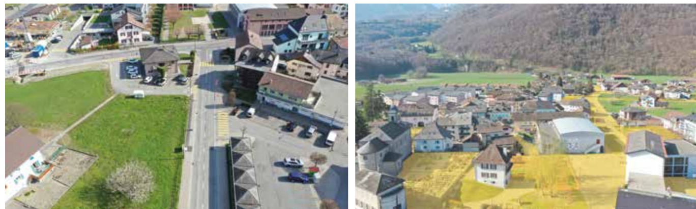
Maillage des espaces publics intégrant le futur quartier Clos-Fleuri. Maillage des espaces publics au sein du village de Massongex.

La commune de Massongex prévoit d'améliorer la qualité de vie des habitants et des travailleurs. Les espaces publics de la commune seront connectés entre eux et liés aux espaces paysagers et naturels. Le développement de l'urbanisation sera accompagné d'une stratégie de requalification des espaces ouverts afin de garantir une bonne qualité de vie. Enfin, l'établissement de nouvelles activités dans les zones artisanales et les zones industrielles existantes sera favorisé afin de maintenir les activités et emplois existants et de garantir une activité économique au sein de la commune. Ces zones seront intégrées au maillage des espaces publics pour faciliter les déplacements des mobilités douces vers le centre de Massongex.