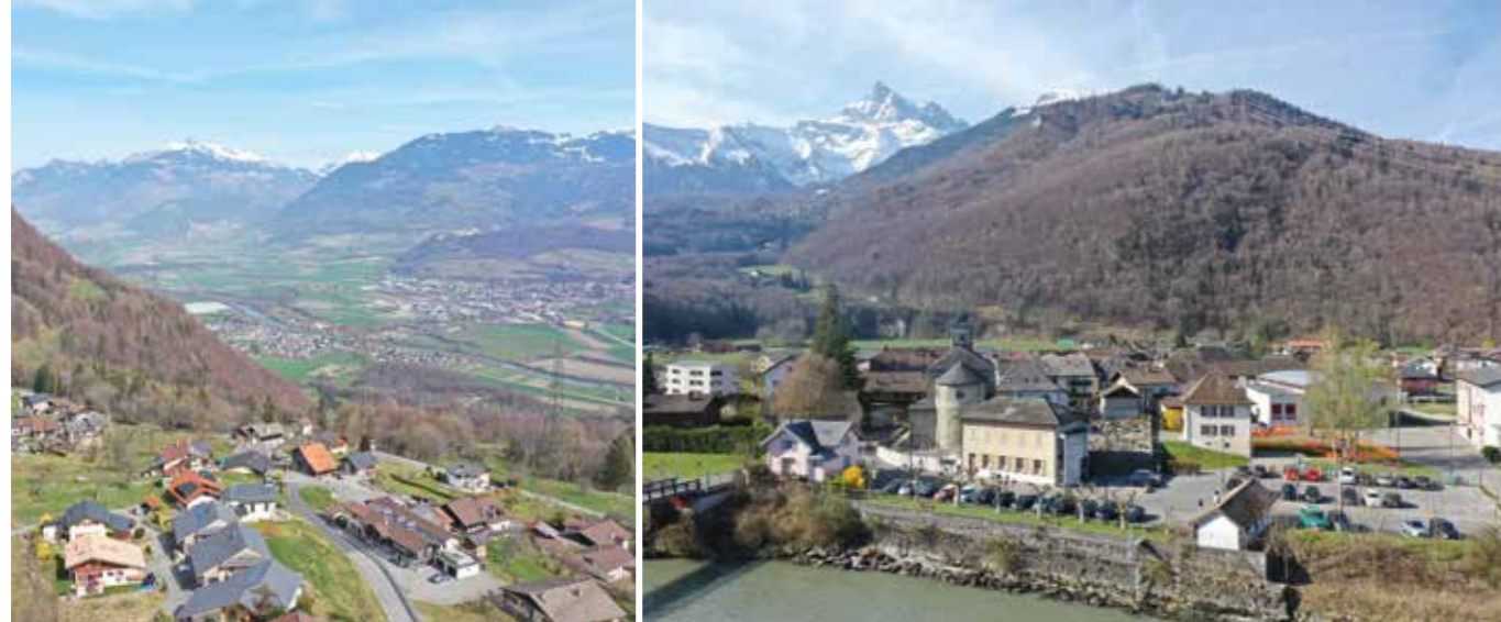
Vues vers le territoire communal et vers le centre historique de Massongex.

La révision de la loi fédérale sur l'aménagement du territoire (LAT) est entrée en vigueur le 1 er mai 2014, imposant aux cantons d'adapter leurs bases légales et leur plan directeur. Le Plan directeur cantonal (PDC), approuvé par le Conseil fédéral le 1 er mai 2019, propose d'introduire un périmètre d'urbanisation comprenant les besoins de développement pour les 25 à 30 prochaines années.