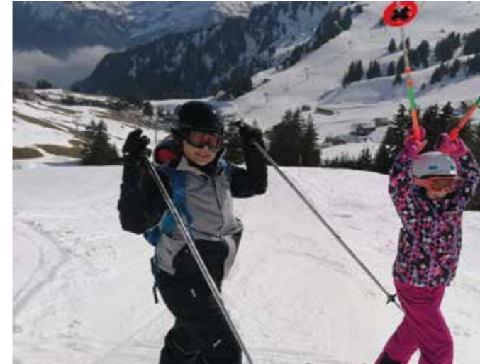
Conditions printanières le 6 mars 2021.

La nouvelle expérience de cette saison valait la peine d'être vécue même si nous espérons revenir au plus vite à une organisation plus traditionnelle et conviviale de nos sorties, ce qui constitue la vraie marque du SC Cime de l'Est.